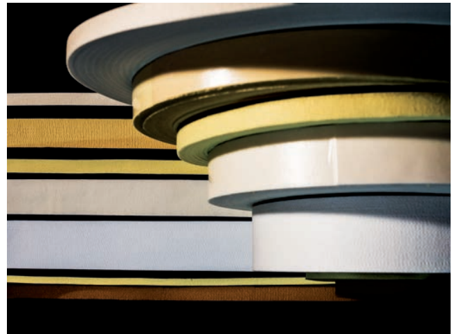
Endlose Streifen in variabler Breite

BWF Tec GmbH & Co. KG Wilhelm-Maybach-Straße 5 95028 Hof-Gattendorf Deutschland T +49 9281 85008-0 info@bwf-protec.de