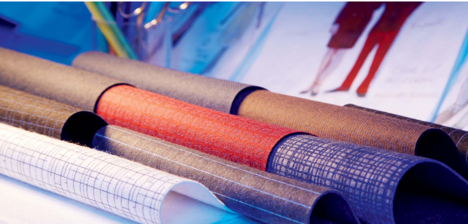
Bedruckter Unterkragenfilz Printed undercollar felt

UCK / UBC: These thinner felts with high wool content are ideally suited for fusing.